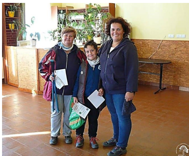
Legidősebb túrázónk (a fotón balra) ----- legfiatalabb túrázónk (középen)