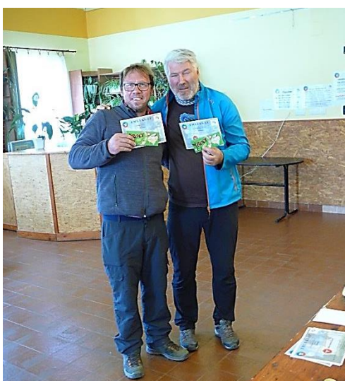
Születésnapos túrázónk (a fotón jobbra)

Mindig öröm számunkra, hogy a visszatérő túrázók és baráti társaságok mellett sok család is érkezik a ZIRC30 túrákra. A Zirci Reguly Antal Német Nemzetiségi Nyelvoktató Általános Iskola 8/B. osztályának és néhány korábbi tanítványának már másodszer választotta kellemes